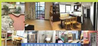
조용한 주택가에 쾌적한 환경을 제공합니다

☎ 03-3802-8817 ✉ dbc-info@d-b-c.co.jp 〒116-0013 東京都荒川区西日暮里2-51-8