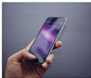
직접 은행에 가지 않아도 온라인으로 해외 송금할 수 있는 앱이 등장했어요.

요즘 스마트폰을 사용해 간편하게 해외송금을 할 수 있는 앱이 등장하여 해외송금을 원하는 사람들에게 많은 인기를 받고 있다. 사용 방식은 간단하다. 앱을 다운로드 받은 후 온라인으로 본인확인을 하고 나서, 수취인 정보를 입력해 송금회사 지정계좌에 송금액을 입금하면 직접 은행에 가지 않아도 해외송금이 가능하다. 스마트폰으로 해외송금을 할 수 있는 앱을 개발한 [월드패밀리 해외송금]은 은행을 경주하지 않고, 해외 제휴사의 네트워크를 이용함으로써 송금시간이 빠르다. 한국이나 인도네시아, 베트남에 송금하는 경우 1시간 이내, 중국에 보내는 경우 오전에 송금신청하면 그 당일 예 송금이 완료 된다. 송금수수료도 저렴하다. 기존은행의 해외송