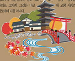
출처:일본문화재단 | 2019년 7월 5일 | 후지산메아리

하지만 상대는 고향이 어디이고 무엇을 따 물어이며 그 같은 오쿠니 타(타)리가 결코 저어 감정의 조장을 잊지는 않음도 기억해야 한다. 메이지유신(明治維新)의 격렬한 진풍 속이 저절로 깨달았던 아이즈(会津) 사람들이 여러 상(商)에게 사할정에게 풍고 있었다. 묵은 감정 정(情)도 어느 한(한)도 그만, 그것은 바로 "내 고향 사랑의 한(한)에다름 아니."