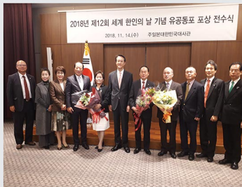
2018년 제12회 세계 한인의 날 기념 유공동포 포상 전수식